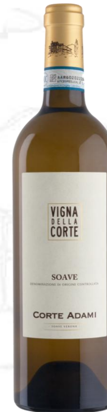
SOAVE DOC "Vigna della Corte" 2014